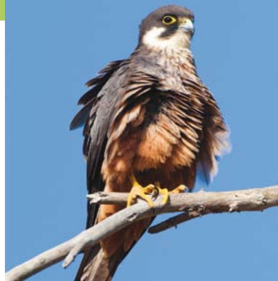
Falco eleonorae

La fauna del Parc és un dels altres aspectes més interessants de l'espai. D'entre la fauna destaca la població de sargantanes de sa Dragonera, una sub-espècie endèmica ( Podarcis lilfordi giglioli ) que no