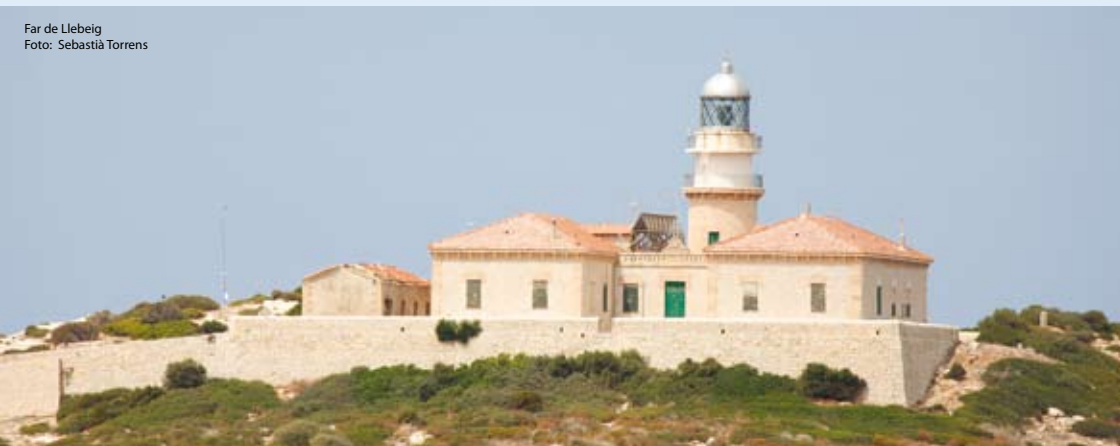
Far de Llebeig

El camí cap a la conservació de l'espai no va ser fàcil, i en bona part la seva protecció es deu a la forta pressió popular en contra de l'intent d'urbanització de l'illa els anys 70. És per això que sa Dragonera és un dels símbols del conservacionisme balear. L'any 1987 el Consell de Mallorca va adquirir l'illa, que fou declarada Àrea natural d'especial interès (ANEI). Finalment, l'any 1995 es convertí en Parc natural.